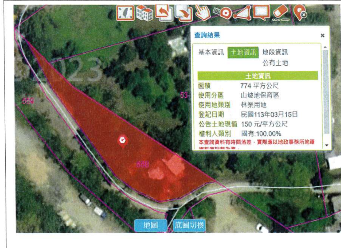
仲岳段 558 地號