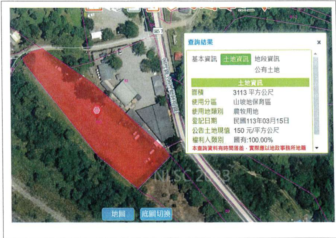
仲岳段 556 地號